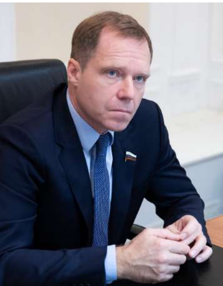
Андрей Викторович Кутепов Председатель Комитета Совета Федерации по экономической политике